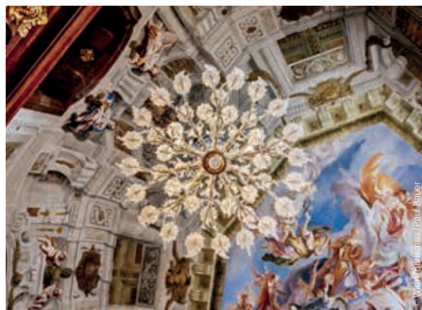
Oberes Belvedere Upper Belvedere

Barrikaden, Camps, Sekundenkleber (bis/until 25.8.) ◆ TROIKA. TERMINAL BEACH (bis/until 11.8.) ◆ ICONIC AUBÖCK. Eine Werkstatt formt den österreichischen Designbegriff ◆ PROUDE TO BE PRIDE (ab / from 4.6.) 1., Stubenring 5 Di / Tue 10.00–21.00 Mi–So / Wed–Sun 10.00–18.00 www.mak.at