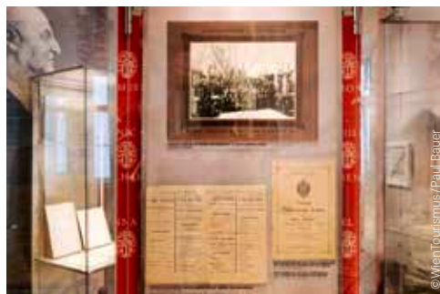
Museum der Wiener Philharmoniker im Haus der Musik Museum of the Vienna Philharmonic in the House of Music

◆ CLASSIC EXCLUSIVE Werke von/Works by Mozart, Beethoven, Haydn, u. a. 1., Annagasse 3b Termine & Tickets/ Schedule & tickets: www.classicexclusive.com