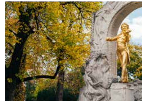
Johann-Strauss-Denkmal, Stadtpark Johann Strauss Monument, Stadtpark