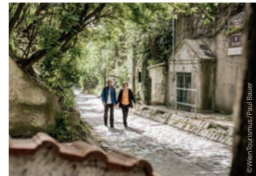
Kellergasse in Stammersdorf Wine cellar alley, Stammersdorf

Jeden Sa / Every Sat FLOHMARKT AM NASCHMARKT FLEA MARKET ON THE NASCHMARKT 6.30–14.00 6., Linke Wienzeile #openair #free entry