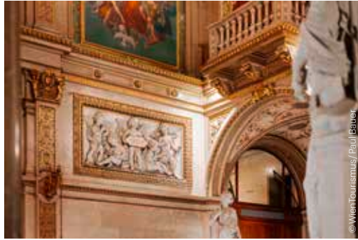
Wiener Staatsoper Vienna State Opera

OPER, OPERETTE, MUSICAL, TANZ OPERA, OPERETTA, MUSICAL, DANCE