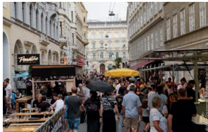
Fest im Freihausviertel Street Party in the Freihausviertel

◆ 20. AFRIKA TAGE 20TH AFRICA DAYS Konzerte, Kulinarik, Basar, Kinderprogramm