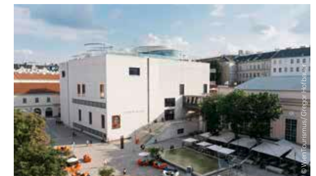
MQ Libelle, Leopold Museum

Kunsthalle Wien MuseumsQuartier ◆ RENE MATIĆ / OSCAR MURILLO. JAZZ (bis / until 28.7.) ◆ GENOSSIN SONNE Di–So / Tue–Sun 11.00–19.00 Do / Thu 11.00–21.00 www.kunsthallewien.at