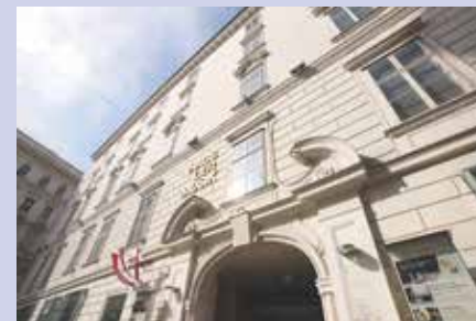
Haus der Musik House of Music

In the “waltz dice game”, visitors roll the dice to generate their own personal waltz at random. Bar by bar, a unique waltz score materializes