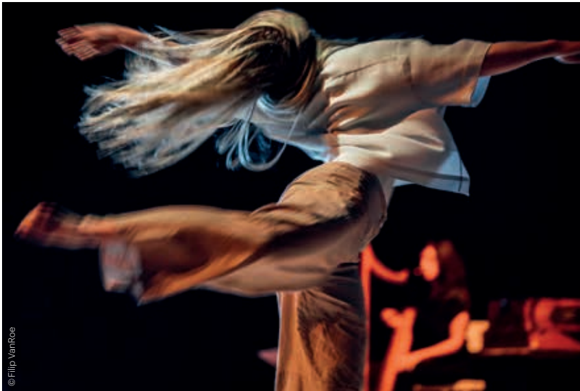
Sidi Larbi Cherkaoui, Eastman, 3S

ImPulsTanz präsentiert von 11. Juli bis 11. August ein außergewöhnlich vielfältiges Programm mit Tanz-Performances, Workshops, Research Projekts, Public Moves und musikalischen Acts.