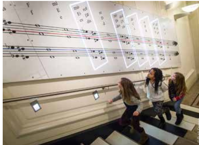
Stairplay – Music Step by Step

Kinder erfreuen sich am „zookonzert“, einer virtuellen Installation, bei der das Krokodil den Blues singt, der Frosch Polka tanzt und der Tausendfüßler steppt.