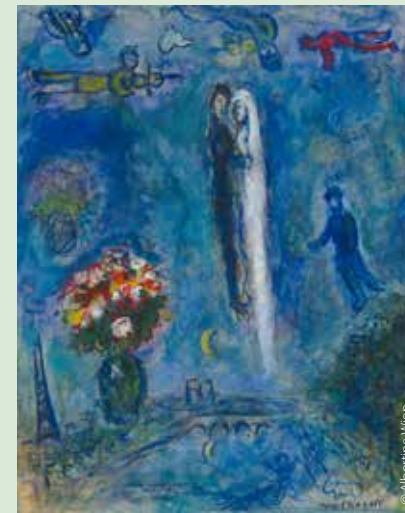
Marc Chagall: Das Brautpaar am blauen Himmel von Paris, um 1976; Gouache, Pastell, Tempera und Bleistift auf Papier Marc Chagall: Bride and Groom in the Blue Sky of Paris, c. 1976; gouache, pastel, tempera and pencil on paper