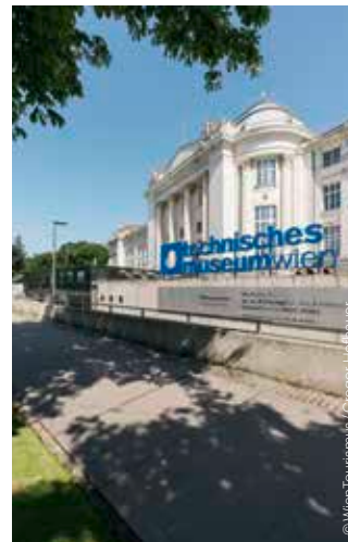
Technisches Museum Wien Vienna Museum of Science and Technology

Technisches Museum Wien ◆ SMART WORLD. Wie künstliche Intelligenz unsere Welt verändert (bis / until 30.6.) ◆ ENERGIEWENDE. Wettlauf mit der Zeit