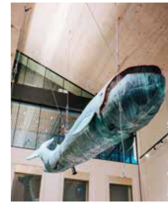
Wien Museum Karlsplatz

Wien Museum Karlsplatz ◆ WIEN. MEINE GESCHICHTE ◆ WINTER IN WIEN. Vom Verschwinden einer Jahreszeit ◆ MIXED – Diverse Geschichten (ab/from 5.12.) 4., Karlsplatz 8 Di, Mi, Fr/Tue, Wed, Fri 9.00-18.00