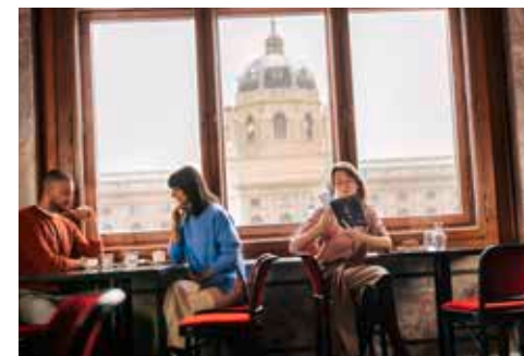
Kunsthistorisches Museum Wien

Das Klangmuseum ◆ ARNOLD SCHÖNBERG. VISIONÄR DER KUNST (bis/ until 6.1.) 1., Seilerstätte 30 täglich/ daily 10.00–22.00 24.12. 10.00–18.00 www.hdm.at