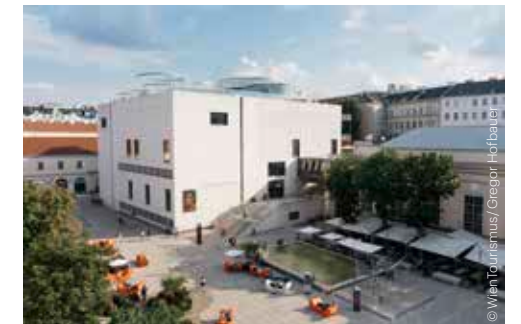
MQ Libelle, Leopold Museum

Leopold Museum ◆ WIEN 1900. Meisterwerke Klimt & Schiele