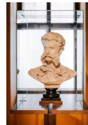
Johann Strauss (Sohn), 1825–1899 Johann Strauss II, 1825–1899

The 2025 Strauss anniversary year will play out under the theme of “King of Waltz. Queen of Music“. Strauss was already revered as the Walzerkönig or Waltz King during his lifetime – eclipsing the achievements of his father, with whom he shared the same name. His