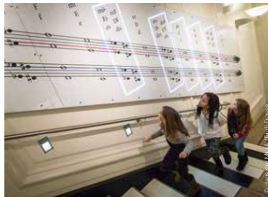
Beim Treppensteigen Klavier spielen im Haus der Musik Playing the piano while climbing the stairs in the House of Music

Eine besondere Empfehlung für Groß und Klein ist das Haus der Musik, Wiens interaktives Klangmuseum. – Ein Abenteuerspielplatz für die Ohren, wo Kinder die Wiener Philharmoniker virtuell dirigieren, ihren eigenen Walzer würfelnd komponieren, ordentlich auf die Pauke hauen, Klänge erforschen, beim Treppensteigen Klavier spielen oder mit Musik am Computer experimentieren können. Auf jeden Fall ist das Haus der Musik mehr als bloß ein Museum. Musik wird hier lebendig und macht Spaß. Nicht fehlen dürfen natürlich Konzerte für jeden Geschmack, von Kinderlied bis Klassik. ♦