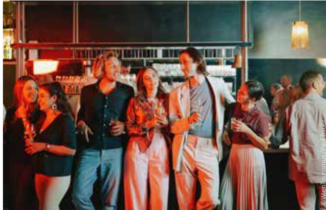
KONZERTE ROCK, POP, JAZZ, WORLD CONCERTS ROCK, POP, JAZZ, WORLD