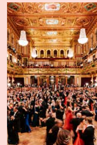
Ball der Wiener Philharmoniker Vienna Philharmonic Ball

◆ WIENER OPERNBALL VIENNA OPERA BALL Wiener Staatsoper www.wiener-staatsoper.at/ operball