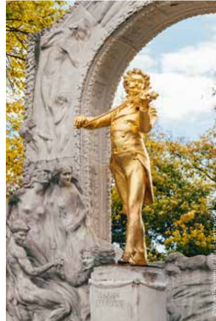
Strauss-Denkmal im Stadtpark Strauss monument in the Stadtpark

Alle großen Wiener Musikinstitutionen machen mit, etwa der Musikverein (Neujahrskonzert), das Wiener Konzerthaus (Anpiff zum