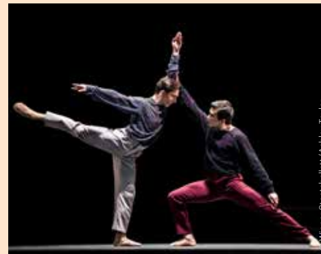
„Peter und der Wolf“, Jugendkompanie des Wiener Staatsballetts Peter and the Wolf Jugendkompanie of the Vienna State Ballet

Lots of Viennese venues have special cultural offers for children and young people, with music programs including everything from song concerts for the little ones to grand opera for older visitors. Opening December 7: the Vienna State Opera's NEST.