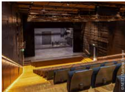
NEST – Neue Staatsoper im Künstlerhaus NEST – The New State Opera at the Künstlerhaus

OPER, OPERETTE, MUSICAL, TANZ OPERA, OPERETTA, MUSICAL, DANCE