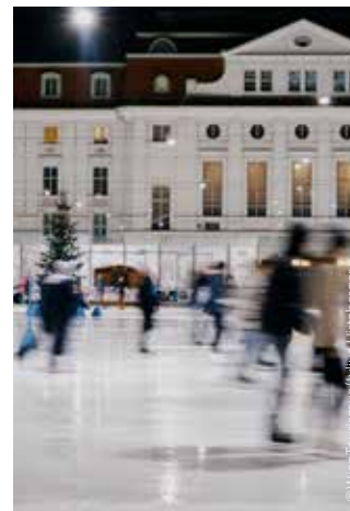
Wiener Eislaufverein Ice Skating Wiener Eislaufverein

◆ 18. WIENER KUNSTSUPERMARKT 18 TH VIENNA ART SUPERMARKET Mo–Fr / Mon–Fri 11.00–19.00 Sa / Sat 10.00–18.00 25., 26.12. | 1., 6.1. geschlossen / closed