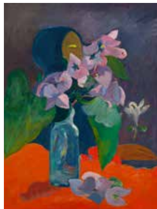
Paul Gauguin, Stillleben mit Blumen und Idol, um 1892 Paul Gauguin, Still Life with Flowers and Idol, around 1892