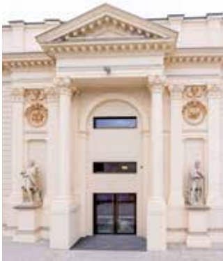
NEST – das neue Musiktheater der Wiener Staatsoper NEST – the new music theater of the Vienna State Opera

Zahlreiche Wiener Kulturstätten haben spezielle Angebote für Kinder und Jugendliche im Musikprogramm, von Liedkonzerten für die Kleinsten bis zu großer Oper für die Älteren. Neu ab 7. Dezember: das NEST der Wiener Staatsoper.