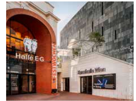
MuseumsQuartier – Halle E+G