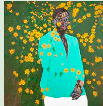
Amoako Boafo, Sunflower Field, 2022 © 2024 Amoako Boafo / Licensed by Bildrecht, Vienna

The Bank Austria Kunstforum Vienna is presenting one of the great pioneers of modernist art, Paul Gauguin (1848-1903). Gauguin. Unexpected is the first retrospective of the French painter's work in