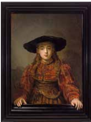
Rembrandt Harmenszoon van Rijn, Mädchen in einem Bilderrahmen, 1641 Rembrandt Harmenszoon van Rijn, The Girl in a Picture Frame, 1641

Die Albertina lädt zum Fest für alle Sinne ein. „Chagall“ ist eine Hommage an den großen russisch-französischen Maler der Moderne. Rund 100 Werke aus acht Jahrzehnten zeigen Marc Chagall (1887–1985)